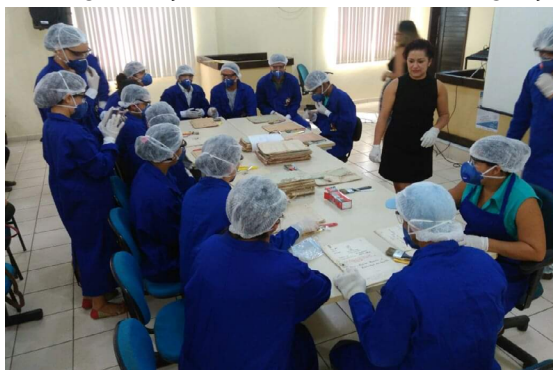
Foto 2 – Oficina de higienização de documentos em Bragança-PA - 2016