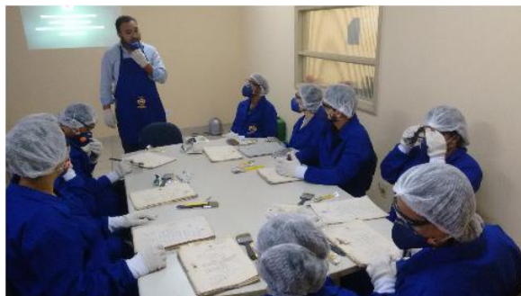
Foto 1 – Oficina de higienização de documentos em Belém-PA - 2016

As oficinas eram realizadas mensalmente e ministradas por professores, técnicos e outros profissionais parceiros do arquivo comprometidos com a valorização do patrimônio documental da Amazônia. Os temas eram voltados ao tratamento e à preservação do acervo documental histórico do judiciário. Assim, foram realizadas oficinas de higienização de documentos, documentação judicial como fonte de pesquisa e descrição arquivística. As oficinas eram realizadas em Belém, porém foi possível realizar uma de higienização de documentos na cidade de Bragança durante a programação da Semana Nacional de Arquivos organizada pelo curso de história da UFPA.