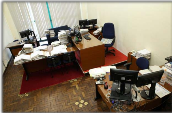
Antes (gabinete e sala de audiências)