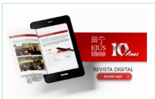
Acesse a Revista Digital "10 anos EJUS"

Em celebração ao seu primeiro decênio, foi lançada uma revista digital que resgata a trajetória da Escola, seus principais marcos, ações e colaboradores, destacando sua vocação para o desenvolvimento institucional e humano.