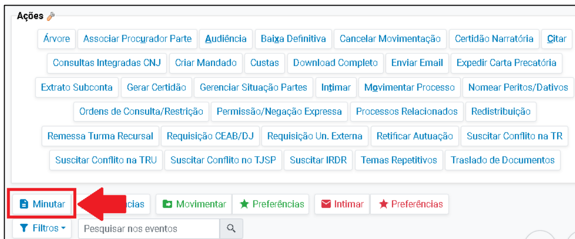
Descrição da imagem: tela "Consulta Processual – Detalhes do Processo" – Botão "Minutar".

Escolha o tipo de documento ou modelo de minuta que deseja criar. Na sequência, é possível selecionar o destinatário.