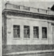
Rio Grande do Sul