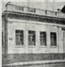
Rio Grande do Sul